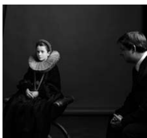
Don Carlos – kronprins av Spanien

BARNPOESIFESTIVAL , idé och regi Madeleine Grive. En musikalisk show för hela familjen presenterad av tidskriften oOTAL.