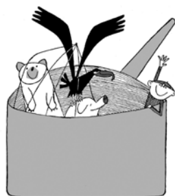
Spagetti – Det har du rätt i