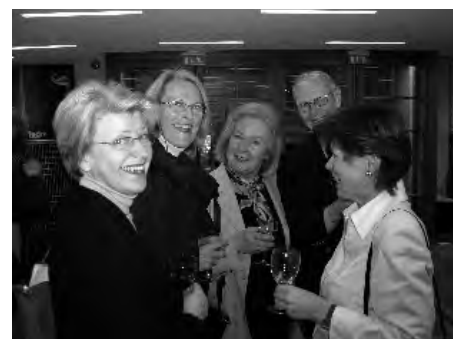
Mingel efter årsmötet.