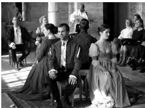
Kören för dagen.