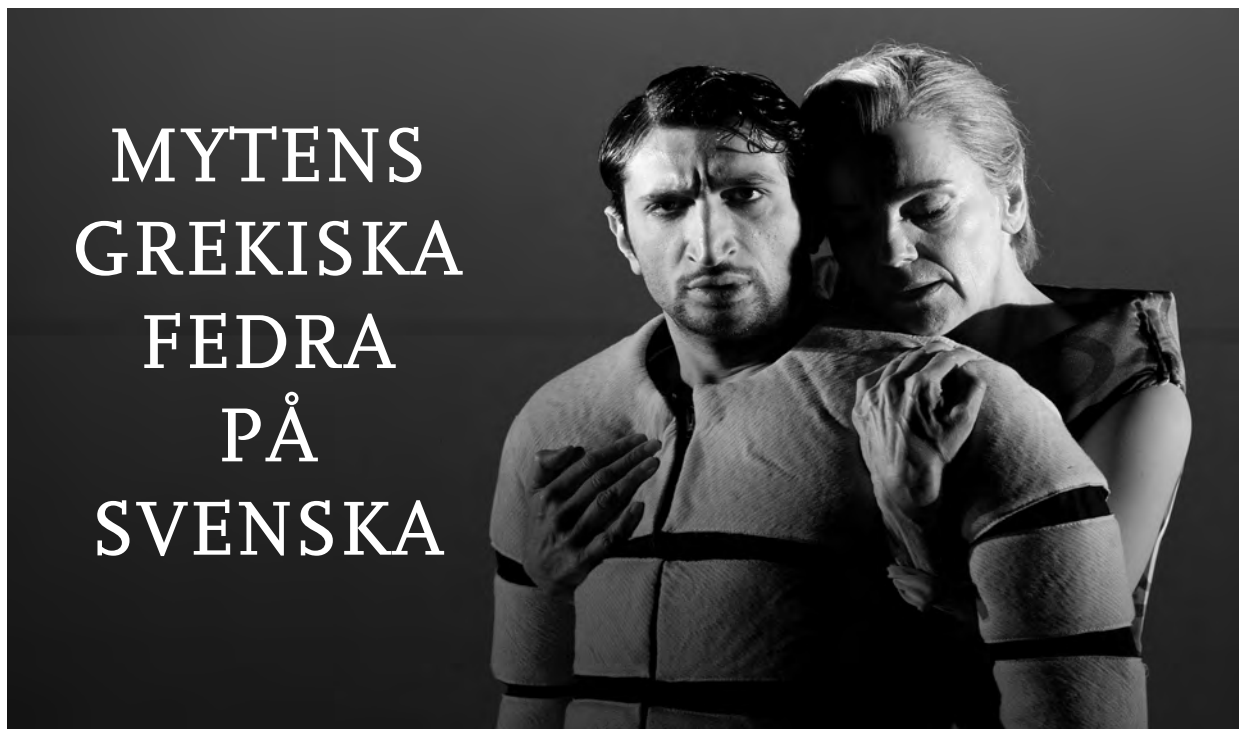
Fares Fares och Stina Ekblad.