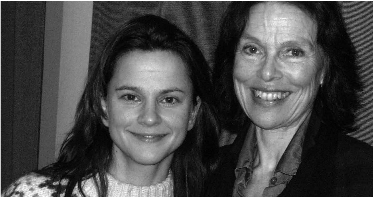
Melinda Kinnaman och Lill Terselius på Elverket.

EN GRÅ NOVEMBERKVÄLL är det knökfullt på Elverket i väntan på den hemlige gästen. Denna afton blev det inte mindre än två skådespelare på scen. Melinda Kinnaman som gäst och Lil Terselius i rollen som intervjuare. De två har genom åren följt varandra och delat både professionella och privata intressen. Vi får ta del av ett samtal mellan kollegor och vänner.