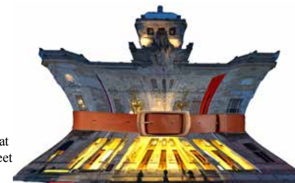
Dramaten drar åt svängremmen. Illustration: Thomas Hultgren

Förra året spelade Dramaten in 47.7 miljoner kronor på sålda biljetter – räcker som synes inte långt i sammanhanget.