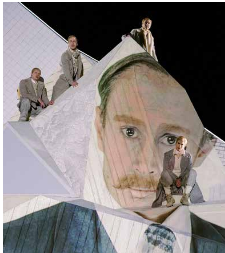
Illustrationen är ur pjäsen Der Zauberberg efter Tomas Manns roman på Burgtheater.

Nästa kväll var det dags för Figaros bröllop på Staatsoper, i en så spirituellt, rolig, fartfylld och samtidigt melankolisk uppsättning att den får mig tro att Mozart själv måste stigit ned från sin himmel och förtrollat musikerna och sångarna denna kväll – en upplevelse av närvarons magi. Staatsoper har ett intressant grepp som förberedelse för publiken: Två dagar innan föreställningen får man ett välkomstmjöl med info och länkar till intervjuer med dirigenten och regissören. Roligare och inget fibblande med scanning av QR-kod som med Dramatens 4-sidiga programblad. Tredje kvällen ägnade jag åt Der Zauberberg efter Thomas Manns roman, på Burgtheater. Den utspelar sig på ett sanatorium högst upp i Alperna kring Davos, filosofiska samtal mellan både patienter, besökare och läkaren om tiden och livet,