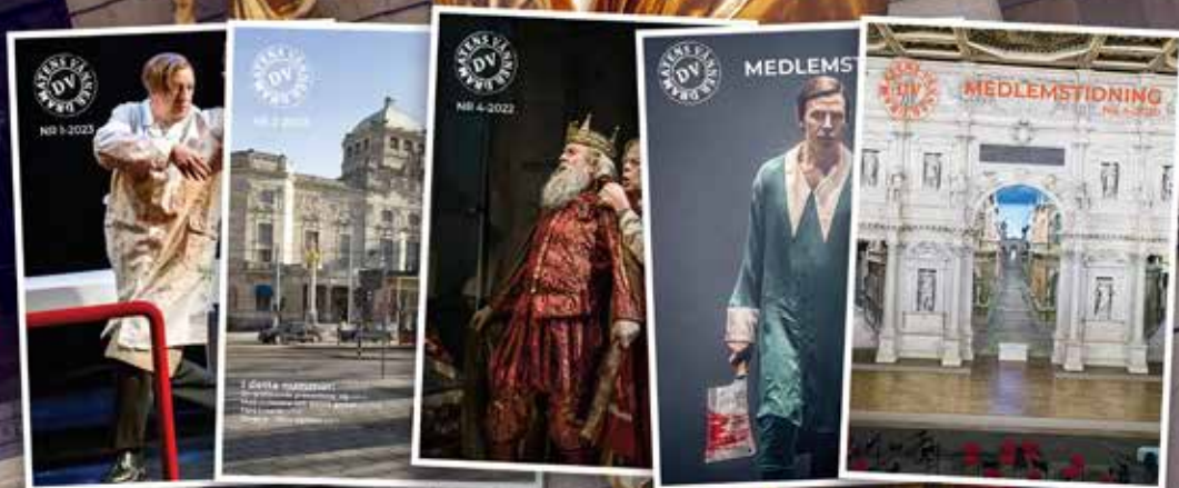
Illustration: Thomas Hultgren

Att plånböckerna känns allt tunnare är knappast någon nyhet att förmedla. Även Dramatens Vänner tvingas konstatera att budgeten inte står i proportion till ambitionerna. Vår lilla tidning drar en alltför stor del av tillgängliga medel. Sen en tid tillbaka ger vi dessutom ut två små broschyrer med Dramatens Vänner vår- resp hösttabläer och berättar kortfattat vad som kan vara av intresse för våra medlemmar. Vidare har vi ju vår egen hemsida, där vi berättar om vår verksamhet. Som bekant har även Dramaten själv minskat sitt informationsutbud.